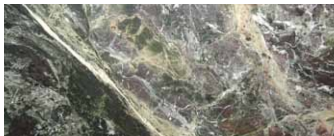
Lastre di rivestimento nel Mobilificio Toscano

Testo e foto di Filippo Belisario Ufficio Comunicazione Riserva Naturale