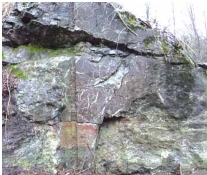
Vecchio fronte di cava

Forse non sono in molti a saperlo, ma nel nostro territorio è presente una particolarità geologica unica in tutta la regione. Sul versante meridionale del Monte Rufeno, infatti, nella valle del Fosso Mandrione, affiora un piccolo lembo di rocce chiamate "ofioliti" che derivano dall'antico fondo di un oceano del Mesozoico, ormai scomparso, come risultato delle continue emissioni di lava basaltica dalle dorsali. Le ofioliti di casa nostra, come altre rocce analoghe presenti in Liguria e Toscana, sono state strappate al loro substrato originario durante l'orogenesi e inglobate nelle falde rocciose sovrapposte che hanno costruito il Preappennino. Questo lungo processo e le forti frizioni tettoniche subite, ne hanno modificato la struttura iniziale, attribuendo a queste pietre le caratteristiche di vere e proprie rocce metamorfiche, note con il nome di "oficalciti".