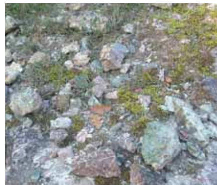
Frammenti sparsi di oficalciti

del Bianchi (dal nome dell'ingegnere che per primo le individuò), con lo scopo di farne manufatti artistici o lastre ornamentali di rivestimento. Curioso sapere che sparsi per la città vi sono dei piccoli pezzi di oceano di oltre 100 milioni di anni fa, come ad esempio un piccolo ciborio nella Cattedrale del S. Sepolcro o le lastre che coprono le pareti dell'ex Albergo Roma (oggi Mobilificio Toscano).