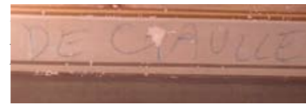
Scritta su di un affresco lasciata dai soldati franco-marocchini durante la seconda guerra mondiale.

Chissà quante epoche, cambiamenti storici, momenti di vita quotidiana di nostri concittadini, sono ancora racchiusi tra le mura di questo splendido cimelio di Acquapendente.. quel vecchio paese nascosto, ricco di meraviglie che aspettano solo di essere riscoperte.